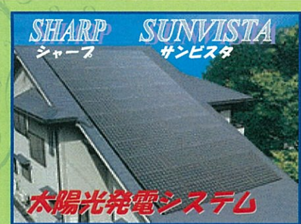
太陽光発電システム

《太陽光発電システム》 + 《オール電化》で 光熱費&CO 2 を削減! 賢い節電&地球環境に 優しいエコライフを ご提案します!