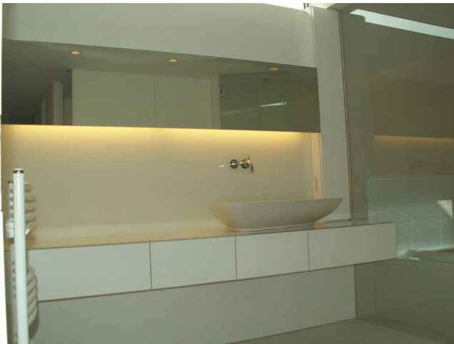
洗面室入り口からの全景。 左側にタオルウォーマーがあります。