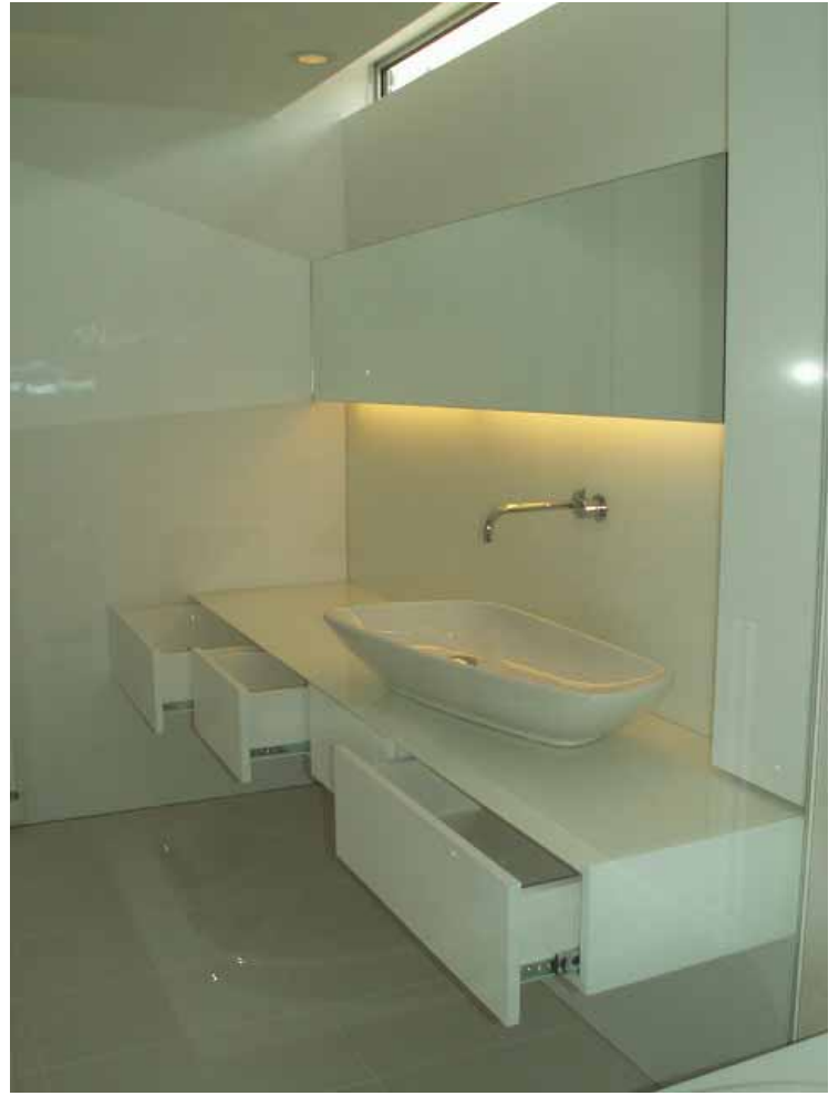
右側の浴室からのガラス越しの洗面全景です。