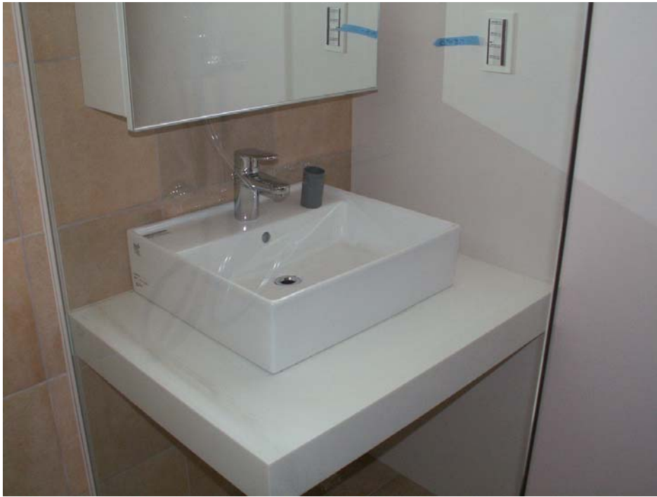
ボウル、水栓金具取り付け完了。