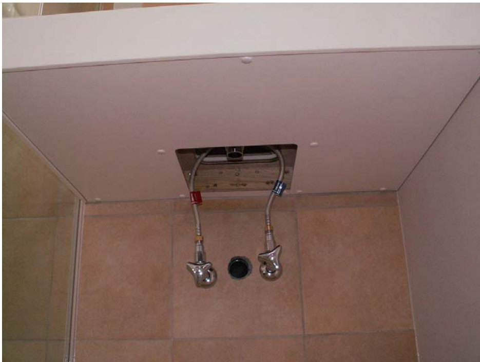
最後にポリ板の化粧蓋の取り付け。