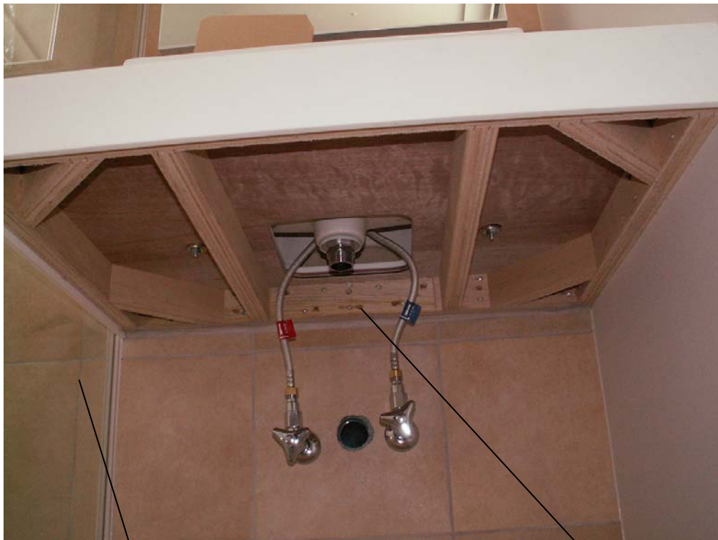
ビスと接着剤にて堅固に固定。