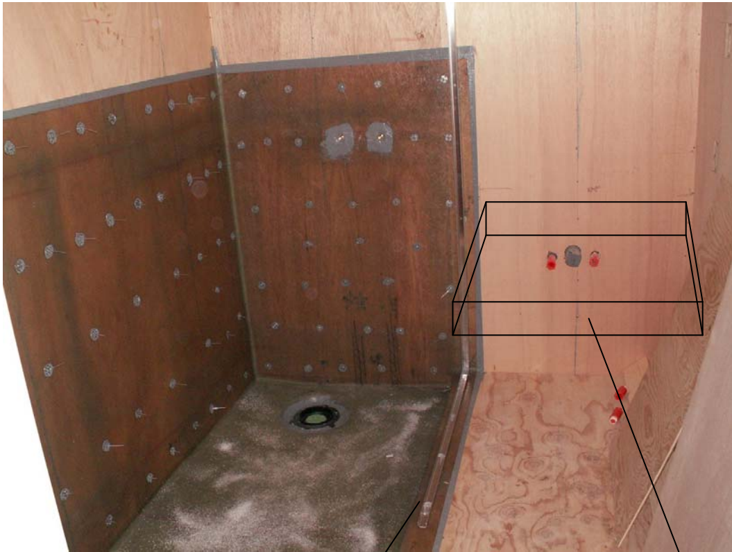
シャワールームの防水処理。