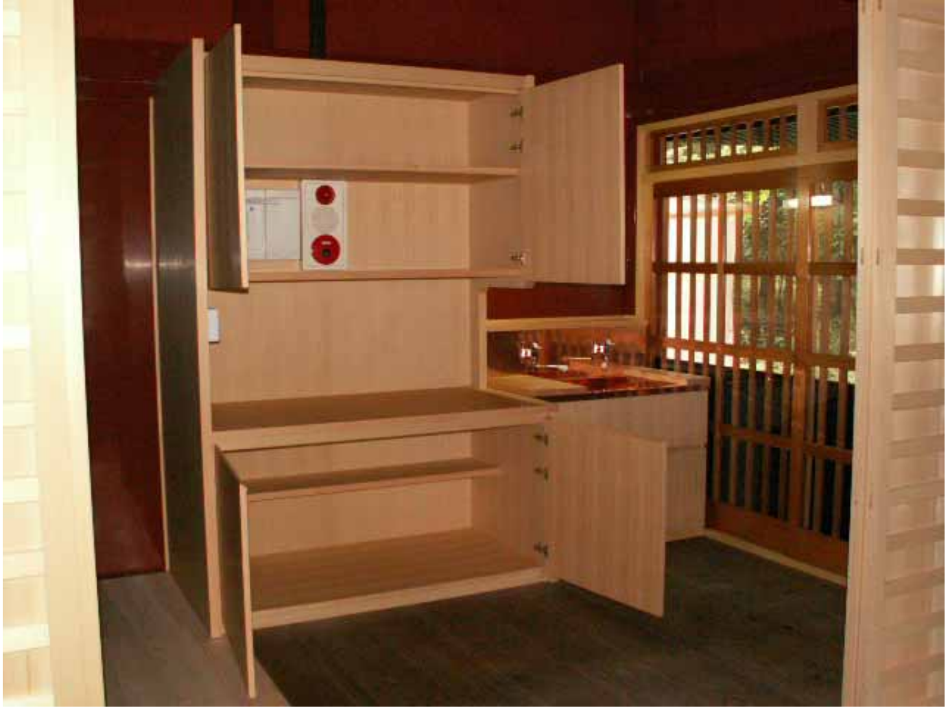
神饌所収納内部状況。