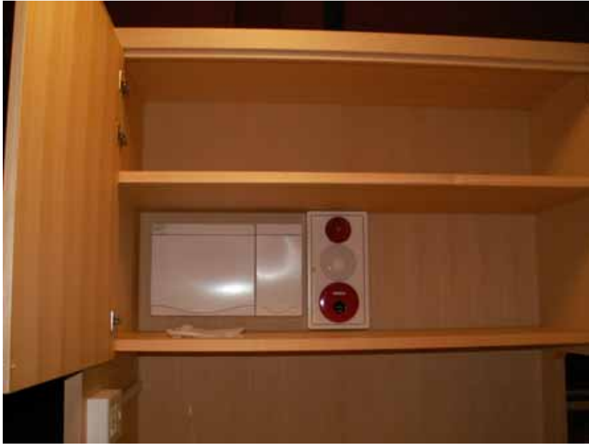
分電盤、火災報知機取り付け状況。 左下側に本殿内照明スイッチです。