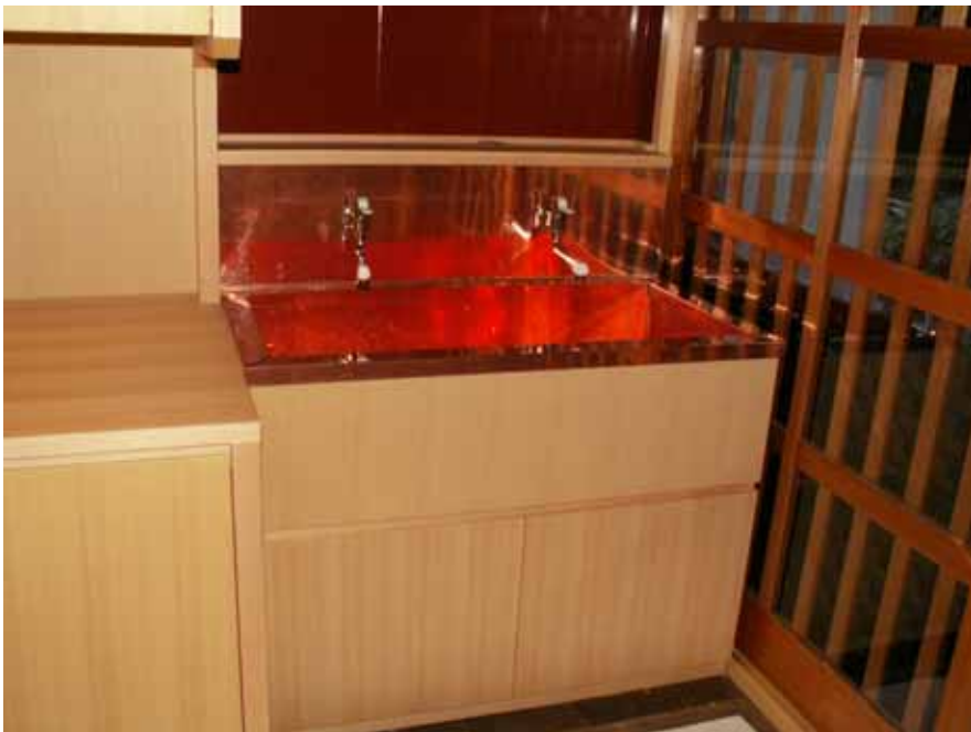
流し台取り付け状況。

(株)マルダイ 家具部 Da・Monde 鈴木 平成 21 年 6 月 18 日