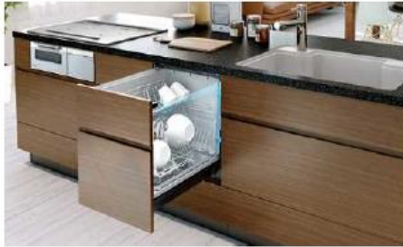
ビルトイン食器洗機