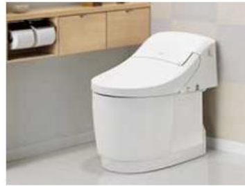
掃除しやすいトイレ