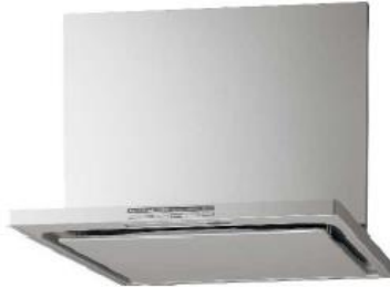
掃除しやすいレンジフード