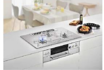
ビルトイン自動調理対応コンロ