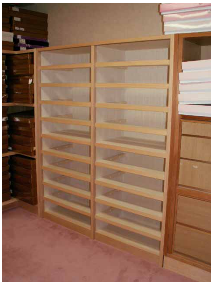
B 面 10 段引出本体セット