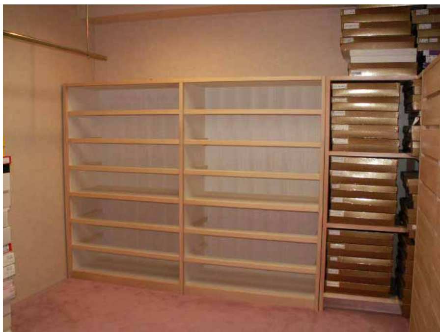
A 面 7 段引出本体セット