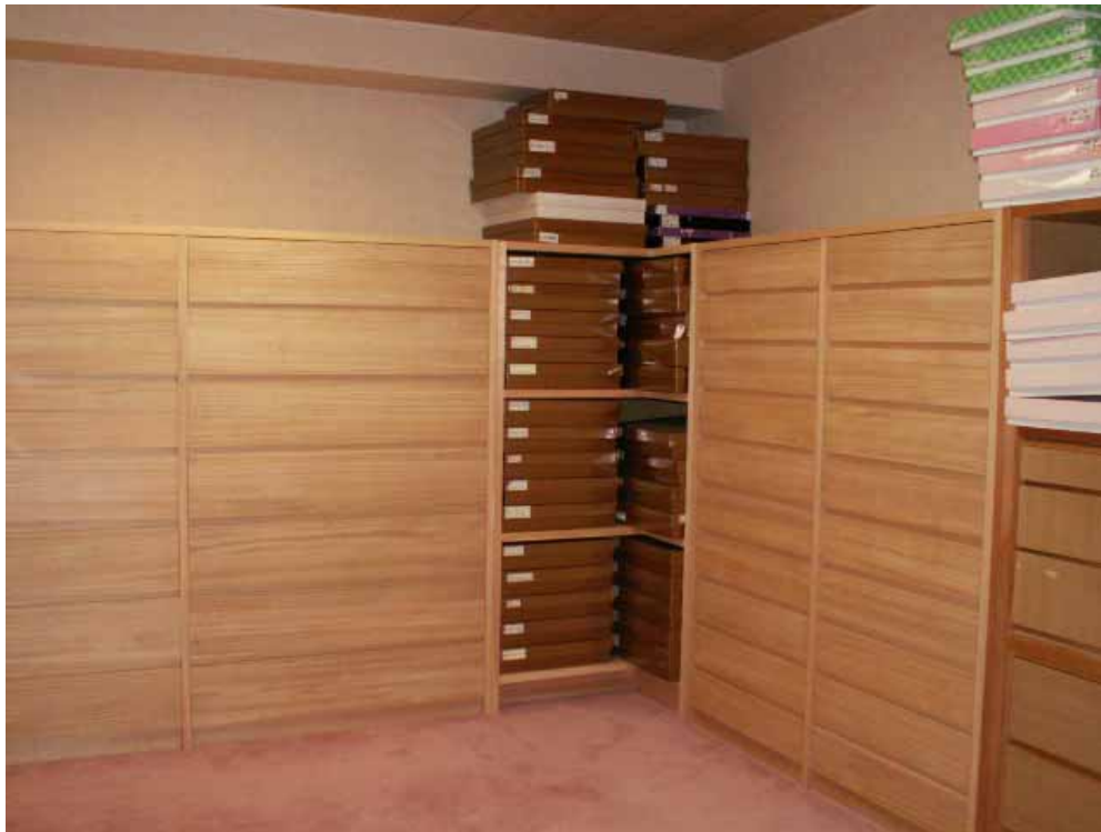
A面、B面引出セット状況。