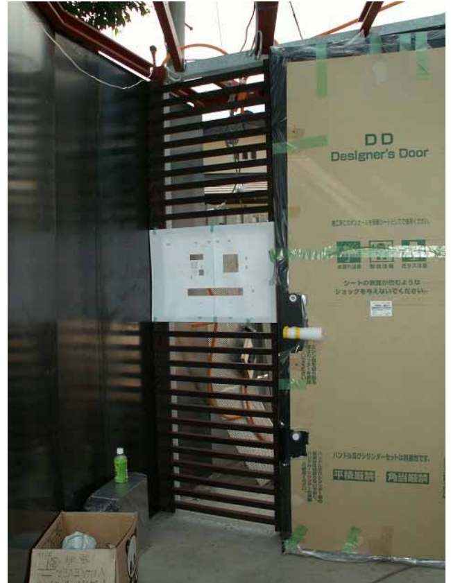
門扉外側からの横格子取り付け状況です。