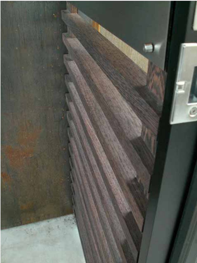
下部横格子取り付け状況。