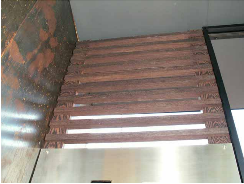
上部横格子取り付け状況。