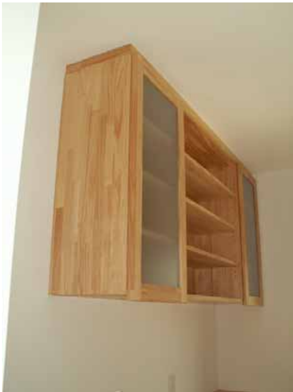
吊り戸棚 ガラスは飛散防止フィルム貼り。