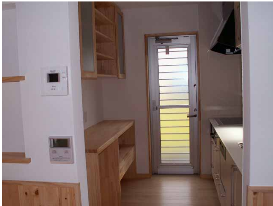
キッチン背面収納位置状況。