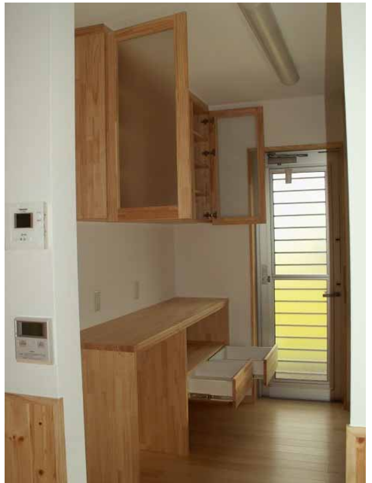
収納部扉、引き出し開放状況。