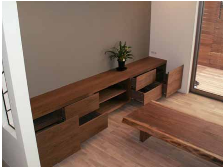
引き出し配置状況。 中央に大型 TV 設置します。