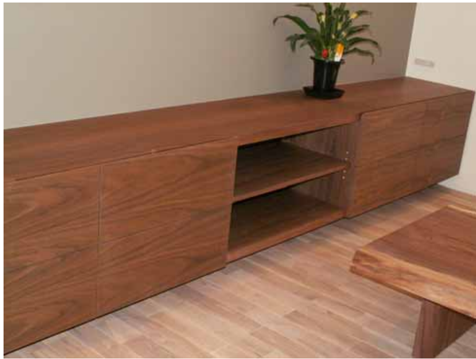
天板：長尺 1 枚貼り