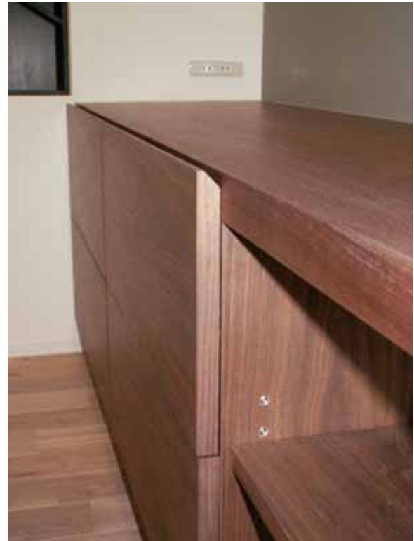
天板と引き出し前板の収まり状況。