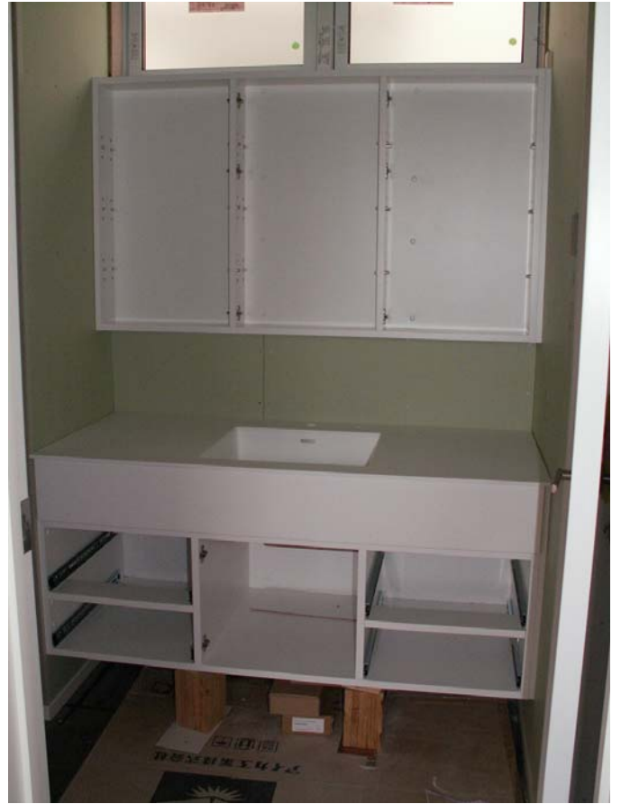
全体箱物の取り付け状況。