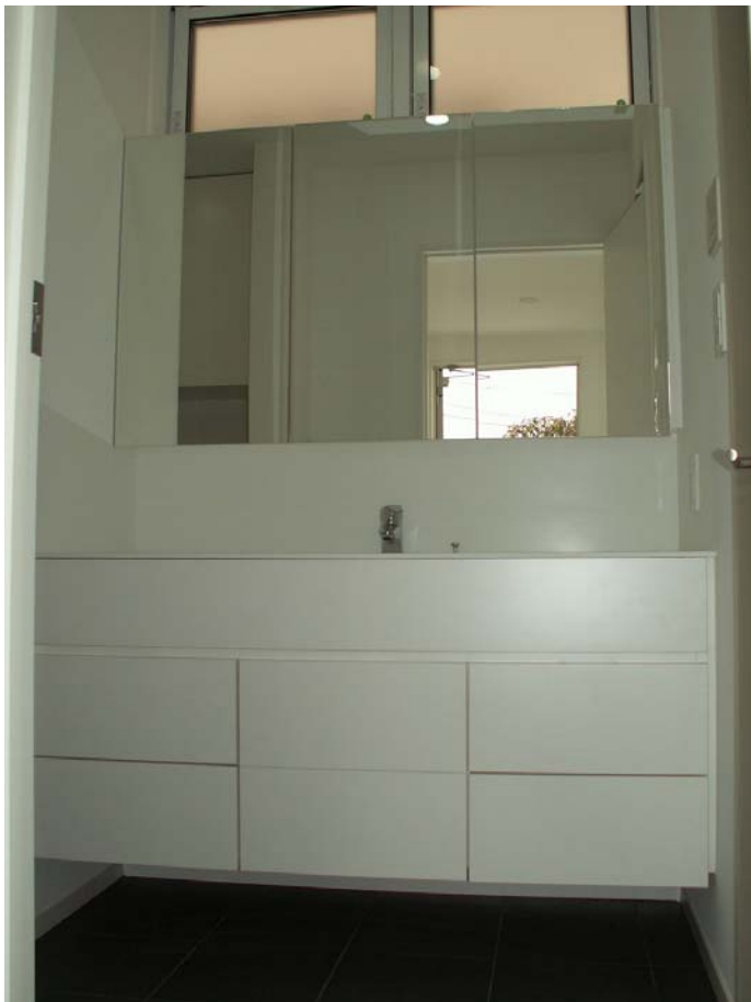
足元スッキリした収納力のある洗面台の完成です。

(株)マルダイ家具部 Da・Monde 鈴木 平成 22 年 11 月 21 日