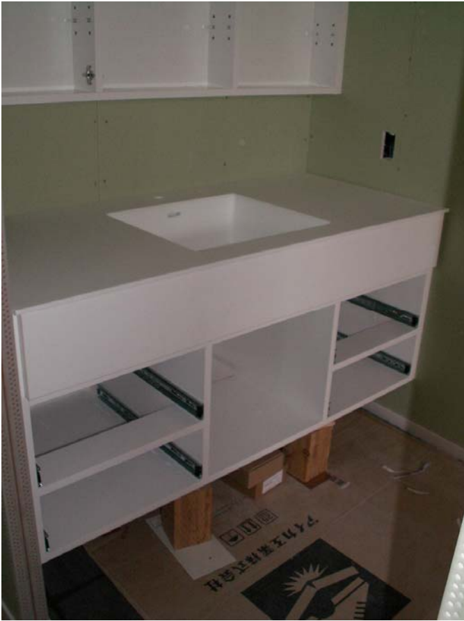
下台の仮固定状況。