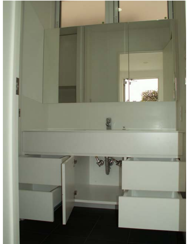
洗面台全体の収納状況。