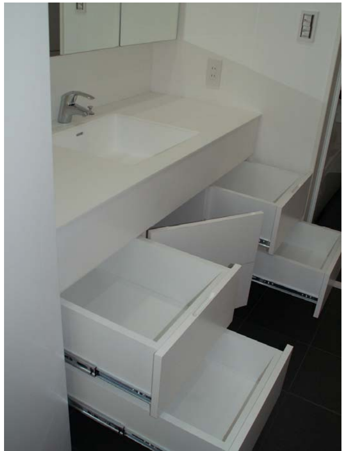
下部カウンターの収納状況。