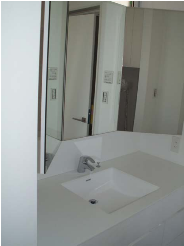
人大の天板、ボウルの納まり状況。