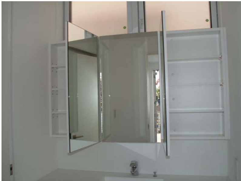
三面鏡収納の収まり状況。