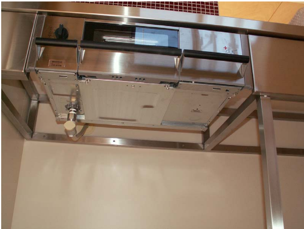
ガスコンロの収まり状況、