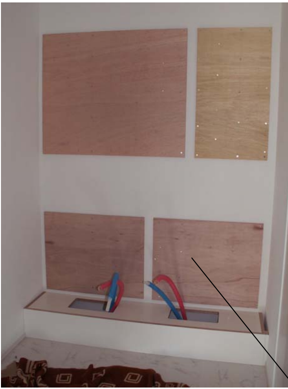
洗面台の台輪の取り付け。