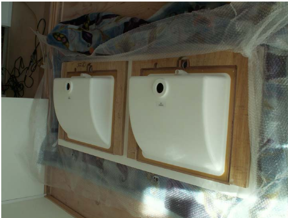
2連洗面ボウルの裏面状況です。

軽量鉄骨だけの家具固定は危険のため、ケイカル板と合板下地を一体化して家具の壁固定が細かく出来るように配慮しました。特に三面鏡部は意外と重量がかかります。なお、家具背板は合板下地 t12.5 分逃げて製作しています。