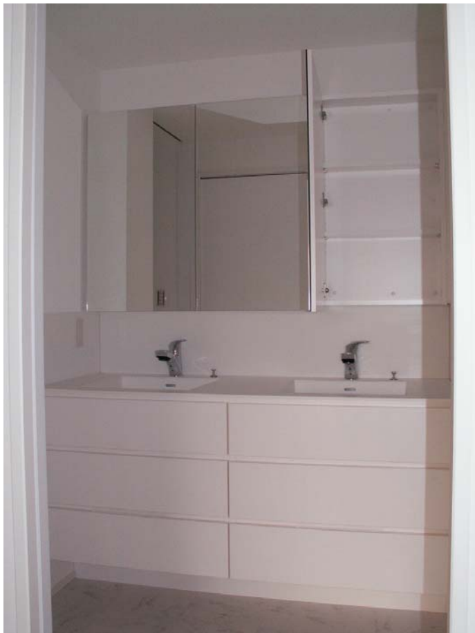
三面鏡のミラー扉間の干渉が無いよう調整。