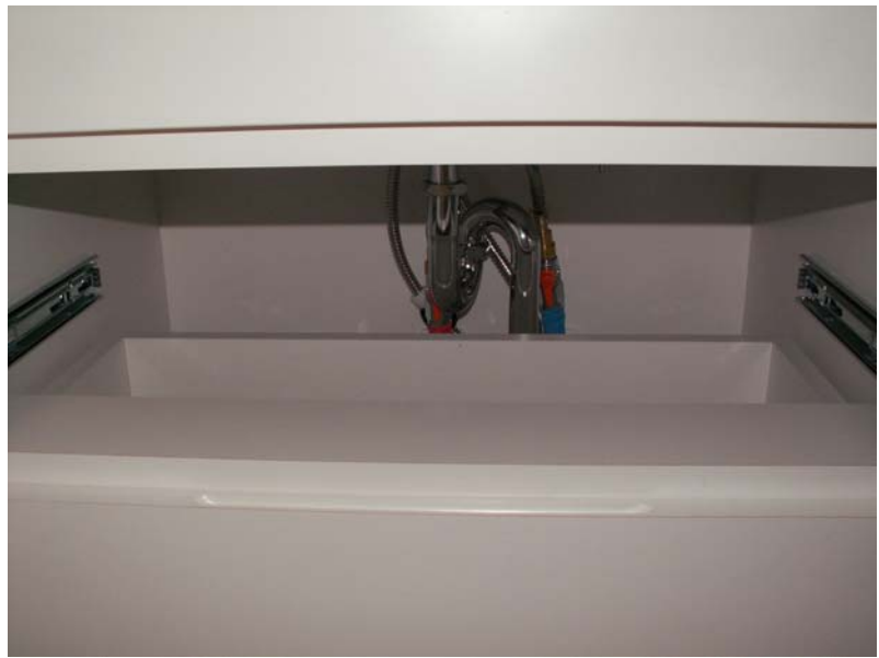
引き出しと配管スペース具合の確認です。