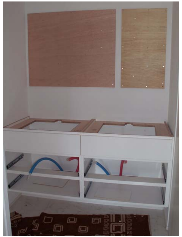
洗面台本体取り付け。

軽量鉄骨だけの家具固定は危険のため、ケイカル板と合板下地を一体化して家具の壁固定が細かく出来るように配慮しました。特に三面鏡部は意外と重量がかかります。なお、家具背板は合板下地 t12.5 分逃げて製作しています。