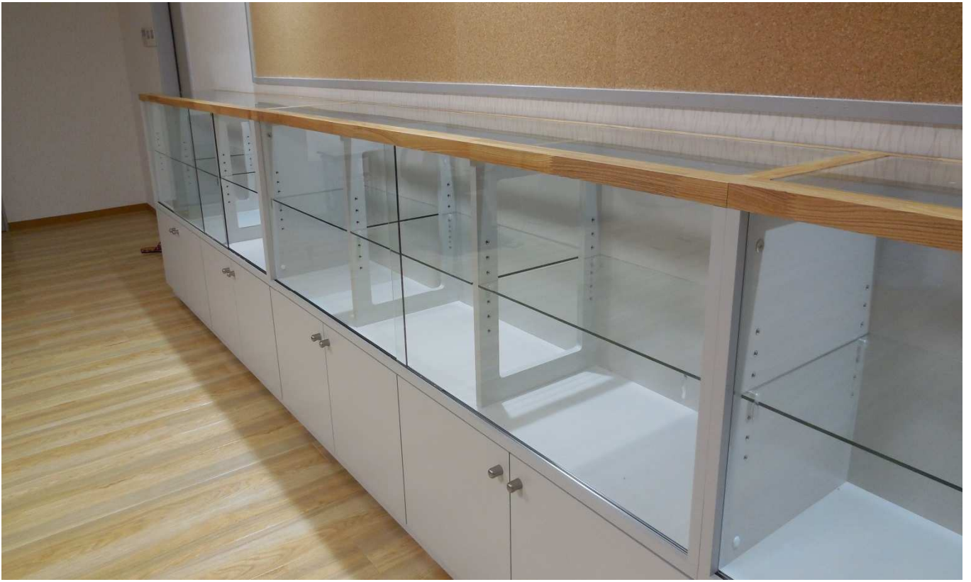
切り抜き仕切り板状況。