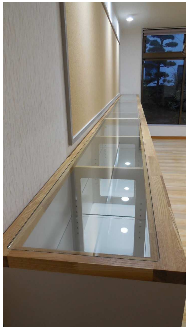
天板ガラス収まり状況。