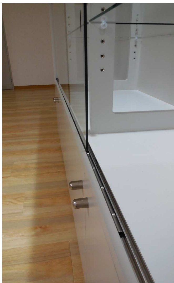
ガラス引き戸のソロバン車状況