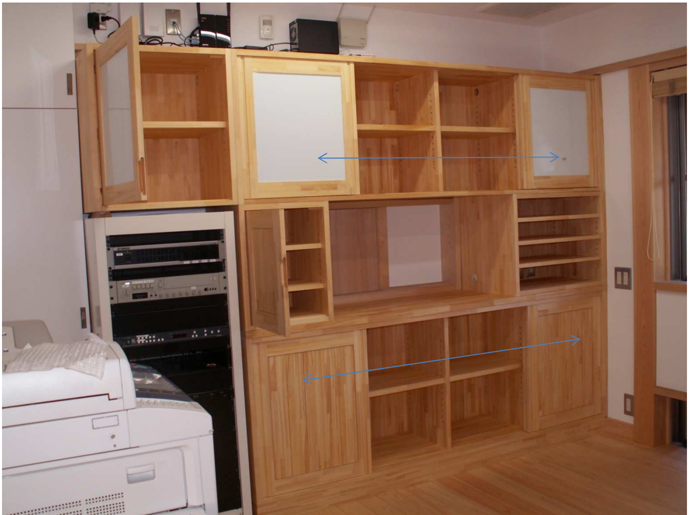
扉オープン状況 矢印；引き戸移動範囲