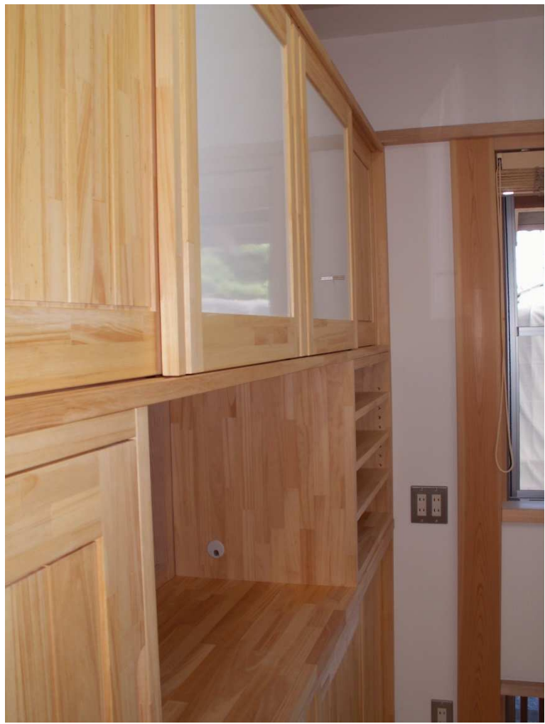
中段、上段収納扉状況。