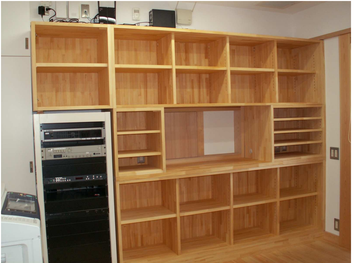
内装箱組立て状況。