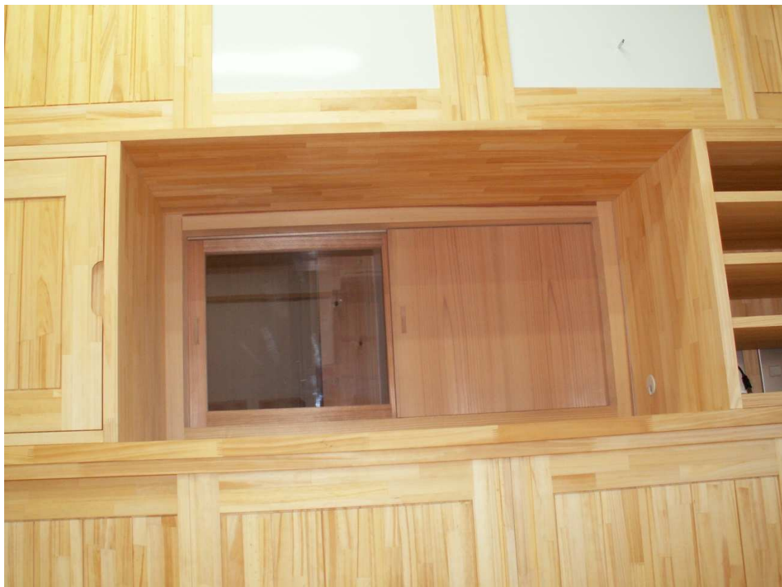
通用口対応小窓部の収まり