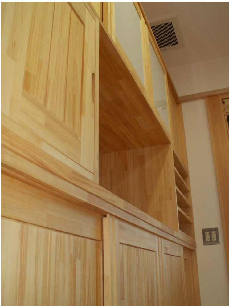
下段、中段、上段収納扉状況。