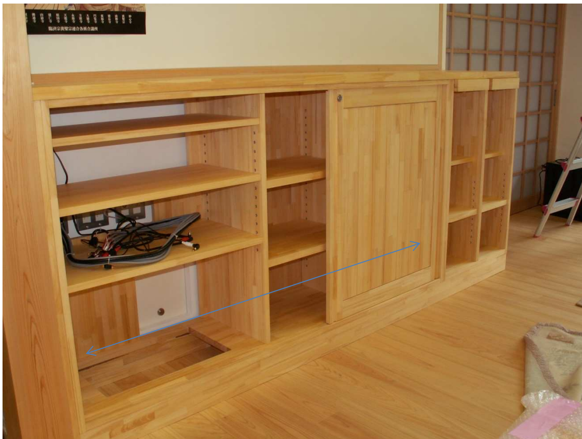
オーディオ部扉引き戸可動範囲