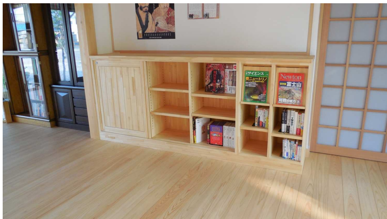
オーディオ部閉鎖状況。

設計通りオーディオ機器のアンプ部の奥行きがネックとなり背板を切り抜くことでなんとか引き戸内に収まることになりました。