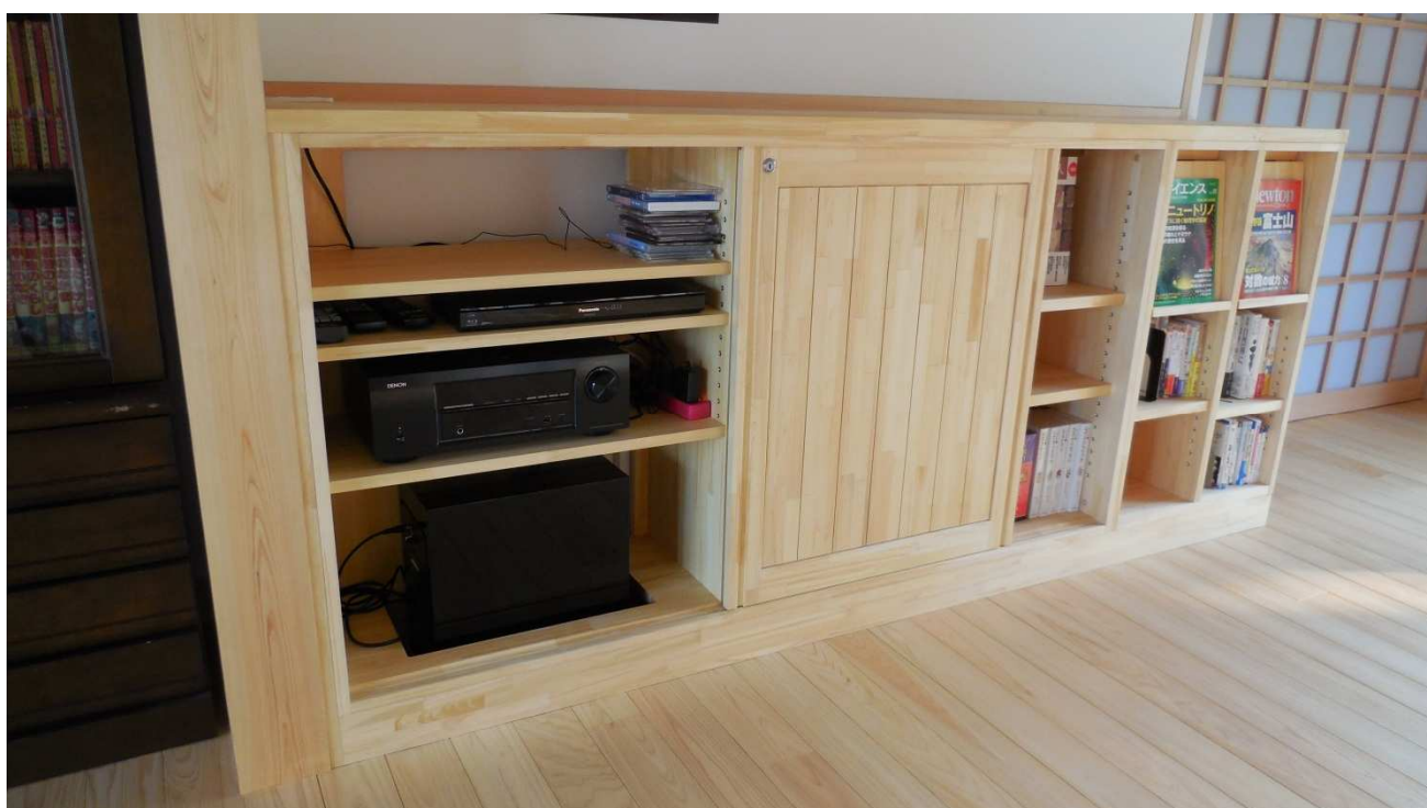
オーディオ部オープン状況。