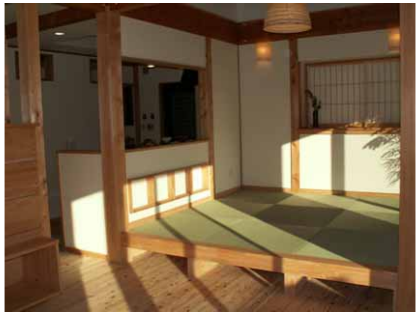
キッチン背面側全景