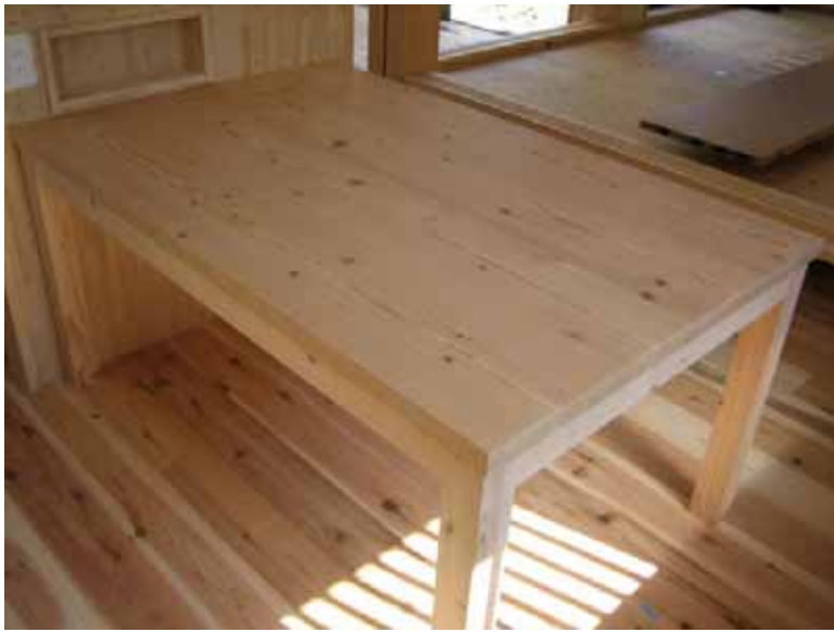
全景。(無塗装状況です。)