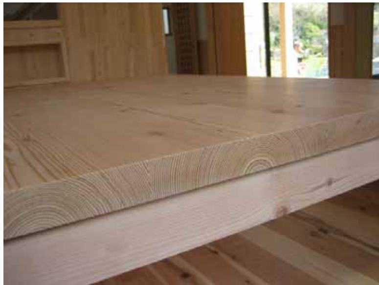
小口きれいですね。