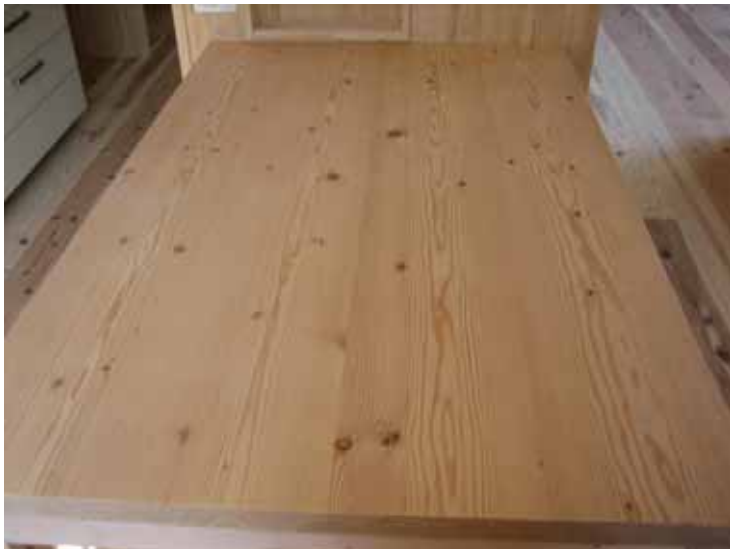
剥ぎ分割状況です。