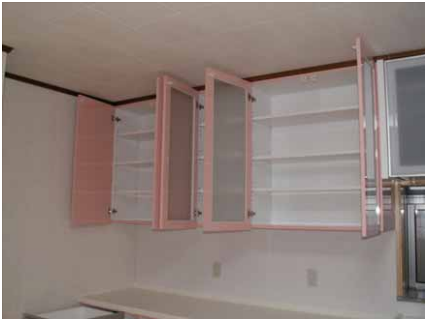
吊戸棚上部耐震ラッチ取り付け。