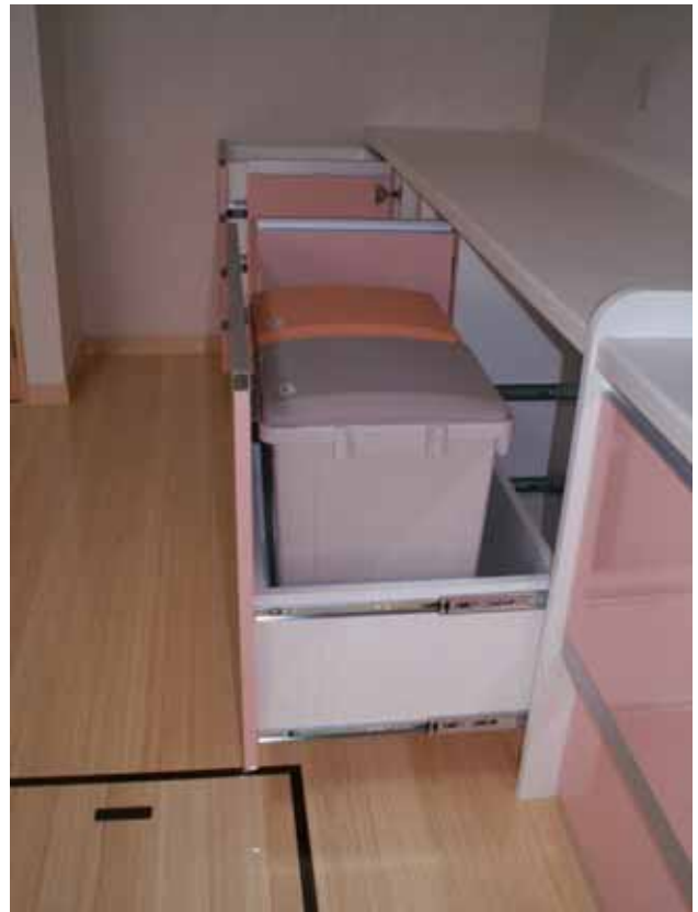
カウンター部全開状況。