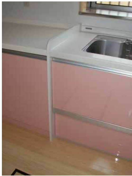
カウンター部接合部収まり。