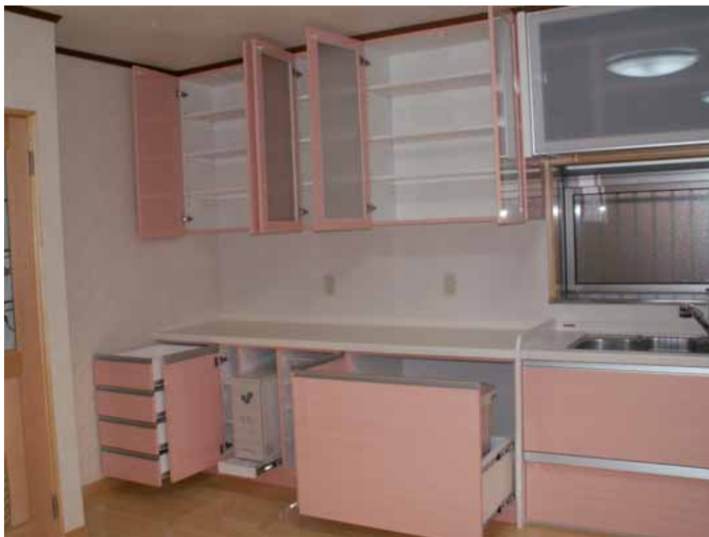
キッチン収納全開状況。