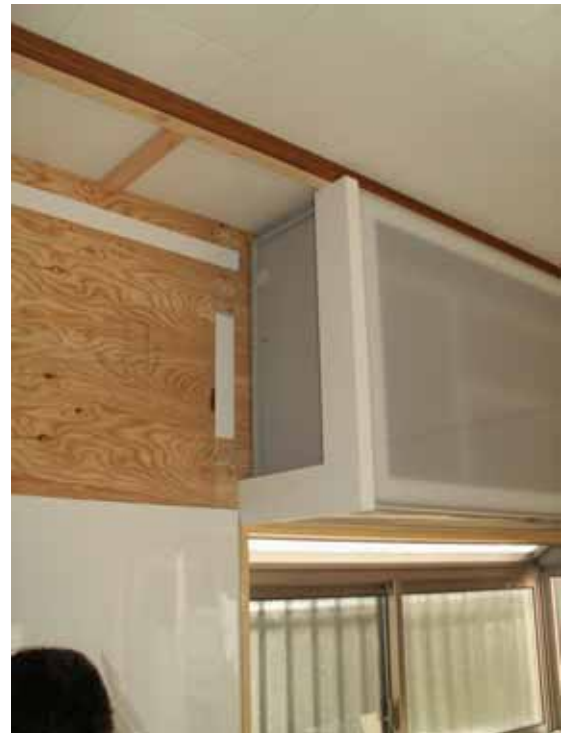
吊戸棚部L型フィラー設置。