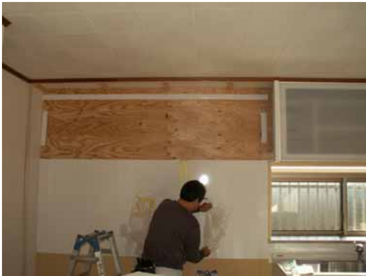
キッチンパネル貼り。