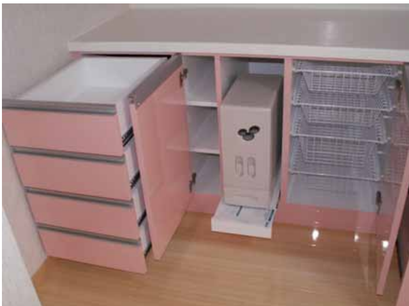
カウンター部内部 左側：フルスライドレール引き出し。 中央：ライサースライド棚。 精米の入れ込み時使用。 右側：ワイヤーバスケット4段。