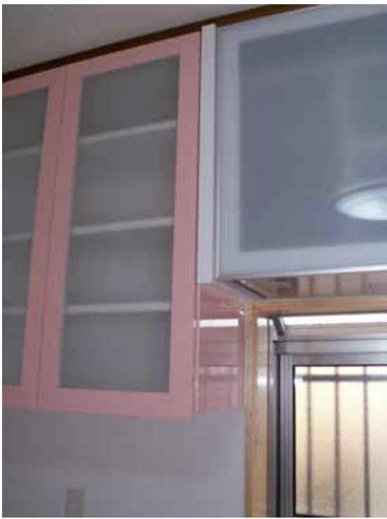
吊戸棚接合部収まり。