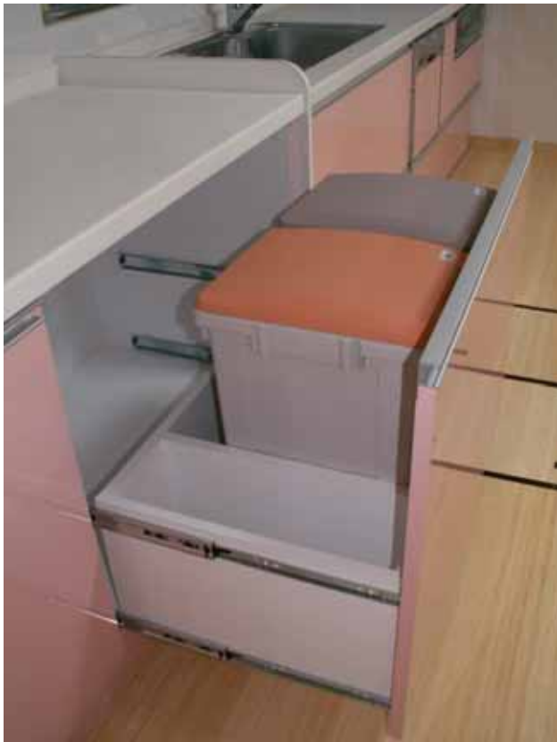
2連ダストボックス。 手前側：一升ビン対応スペース。