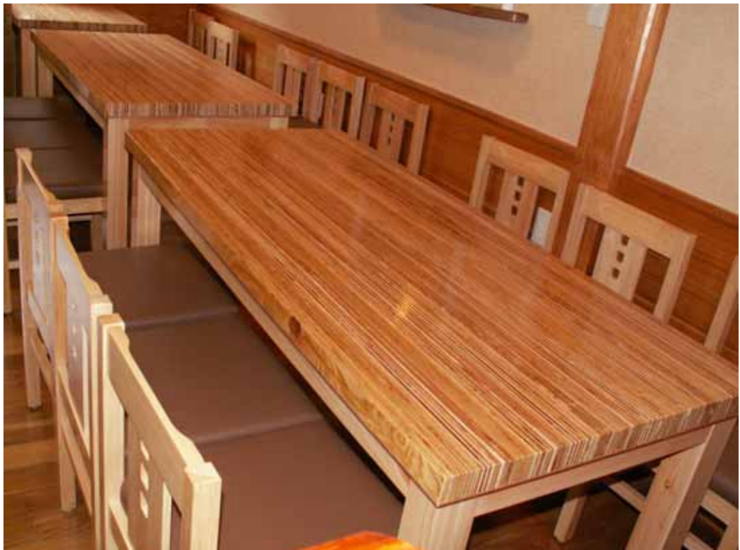
平行合板天板の仕上げ状況です。 チェア：パブリック ユズ