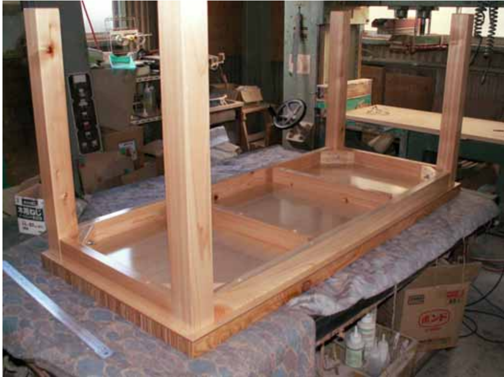
裏張りシナ合板、ひのき脚取り付け状況。丸京製作所にて。