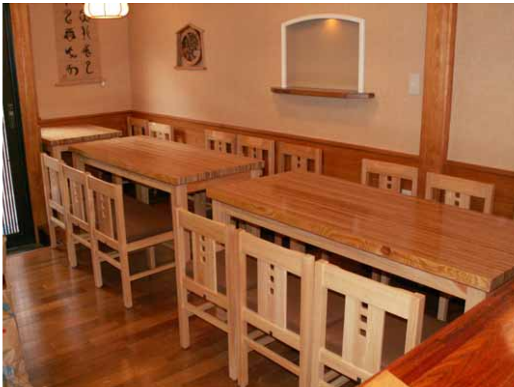
店内レイアウト状況。