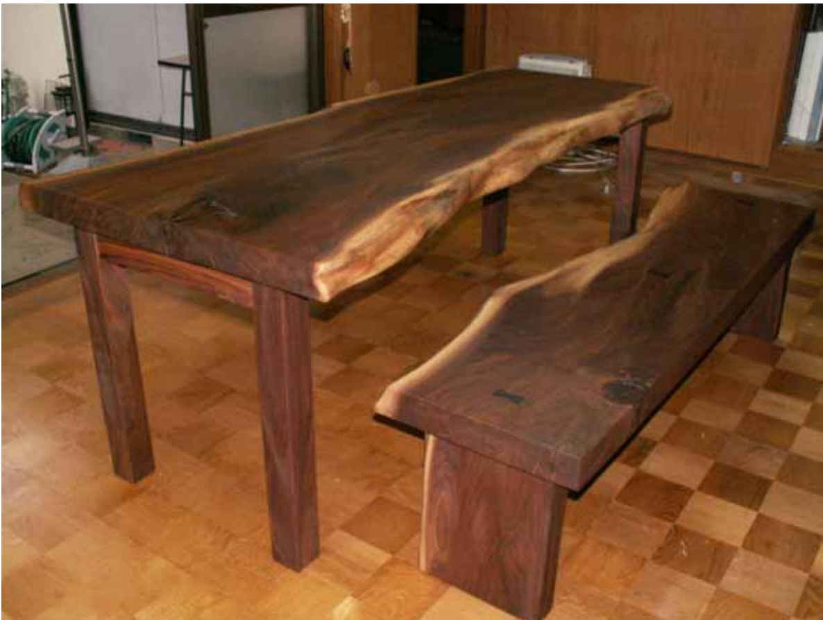
納品セット完了状況です。