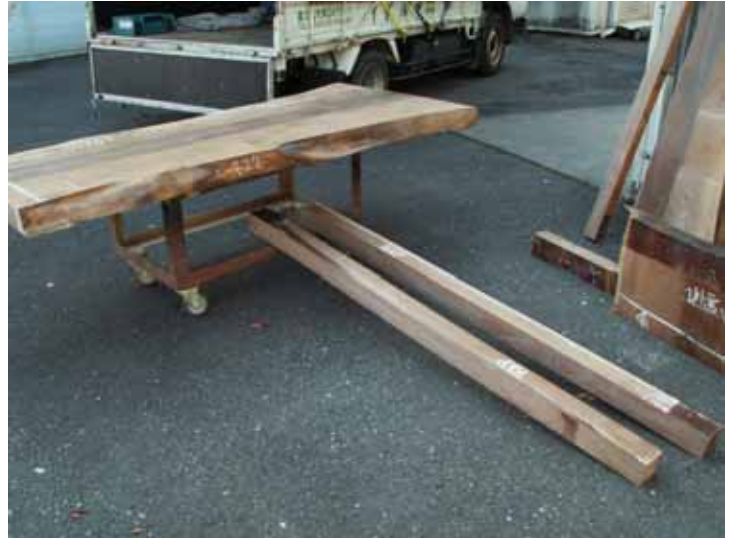
ダイニングテーブル天板と角足材です。