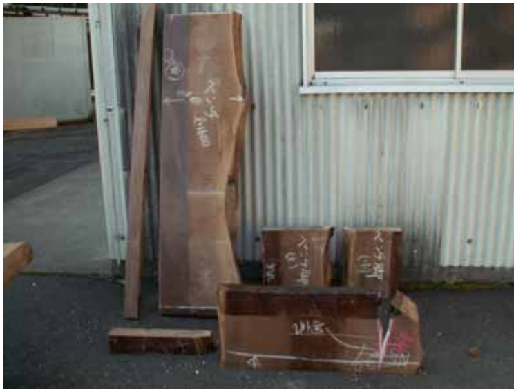
ベンチと板足材です。