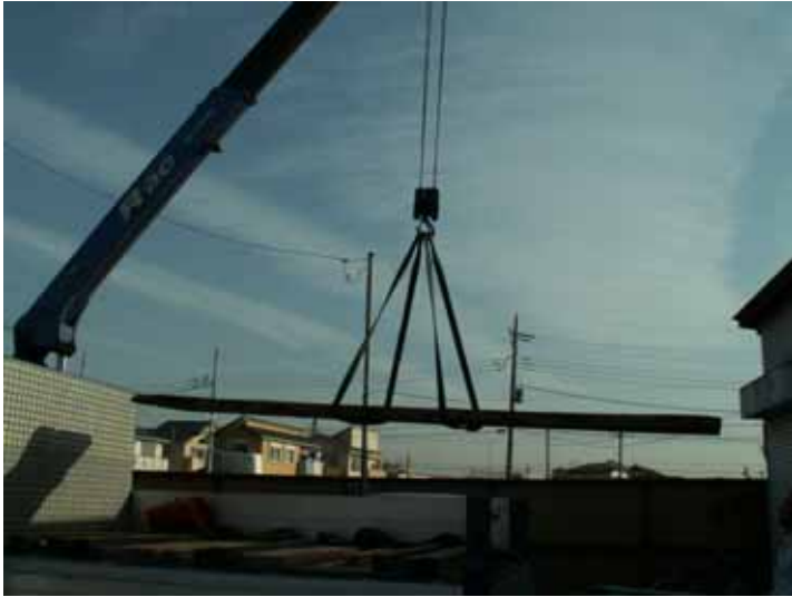
ユニック車にて引き取り、(株)マルダイ迄 運搬。