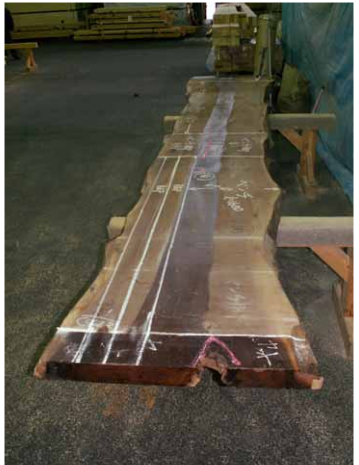
割れ、節等を確認しながら木取りの墨だしを行い、丸鋸でカット致します。 (株)マルダイ プレカット作業ヤードにて