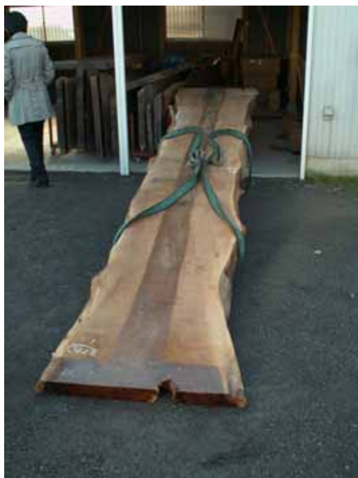
(株)エバグリーンホーム様倉庫より 無垢板を持ち出し。