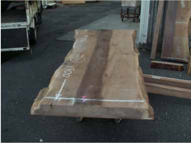
ダイニングテーブル天板です。