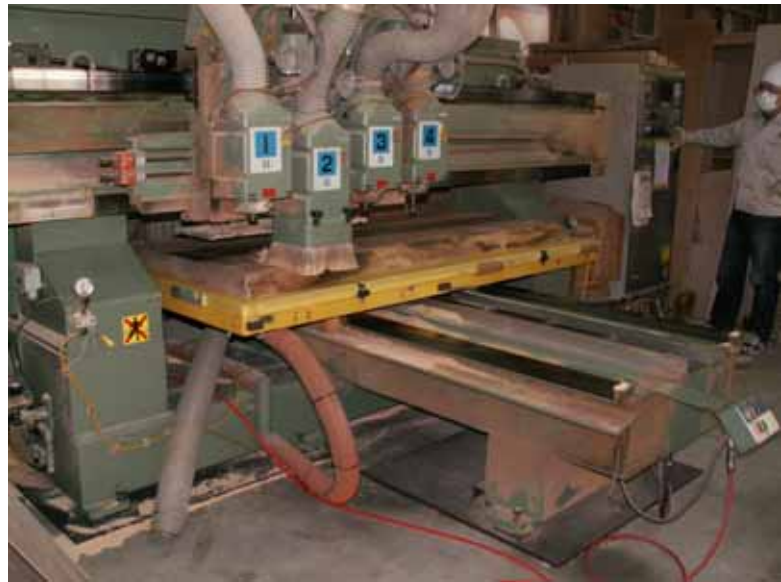
ダイニングテーブル天板、ベンチ座板を NC でフライス加工。 (反り取り除き平坦に致します。) ベンチ座面のチキリをざぐる作業も NC で行います。