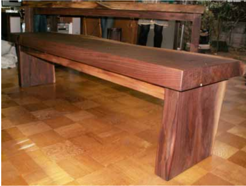
ベンチ板足状況です。 (座板、板足切断面側)