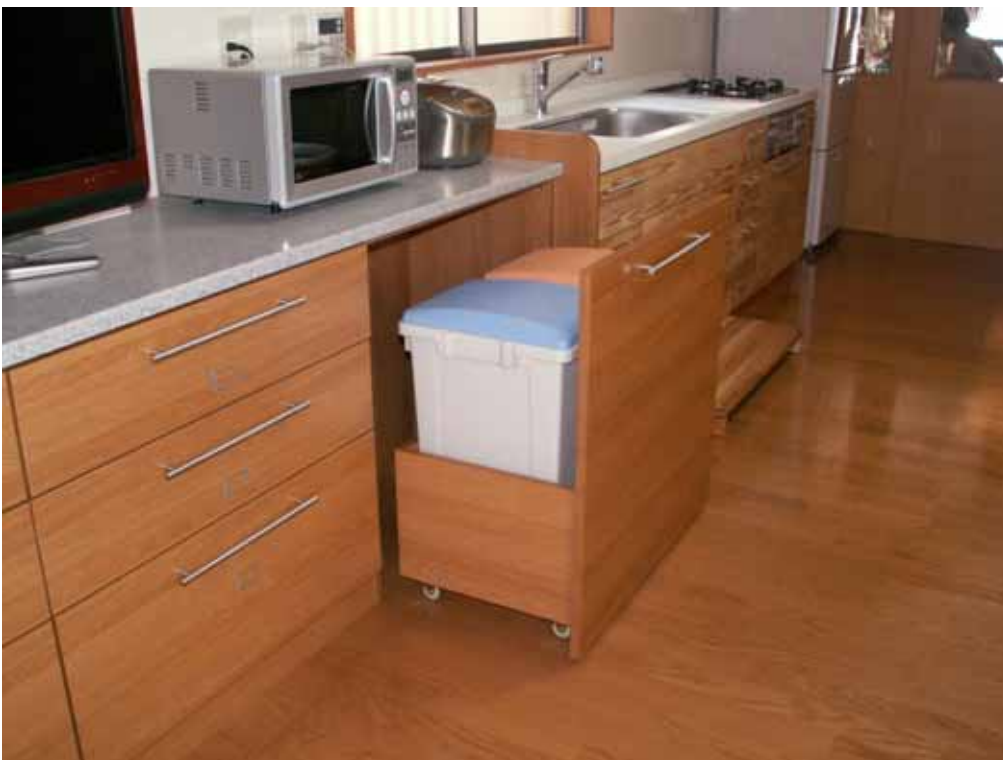
右側2連ダストボックス収納引き出し。(キャスターは、4個とも固定式) キャスターが回転式ですと出し入れの際に横ぶれして側板に当たるため、固定式に交換する。 中央部、左部の最下段引き出しは漬け物用ビン専用です。(漬け物が一目瞭然です。)