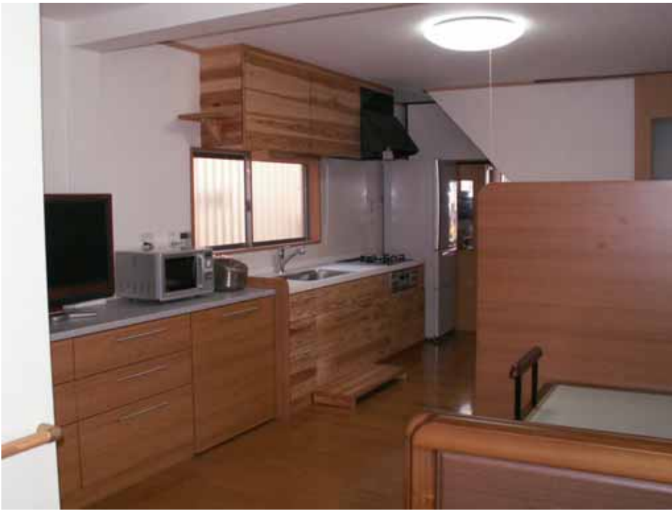
ベッド目隠しパネル状況。パネル：アイカ ポリ 484 奥側 冷蔵庫の向こうは店舗です。