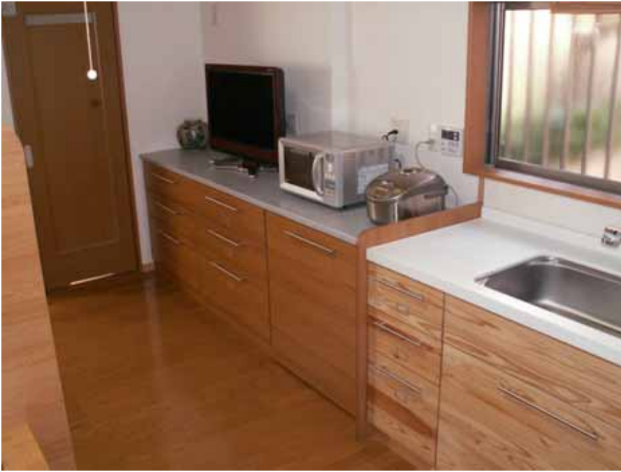
キッチン横のカウンター 引き出し収納です。 天板：人工大理石石目 本体：アイカポリ 484