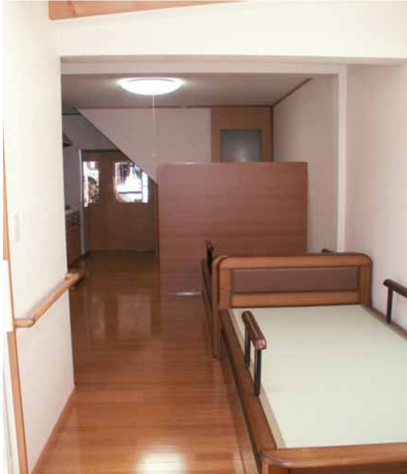
ベッド側より店舗側を見る。 目隠しパネル配置状況。