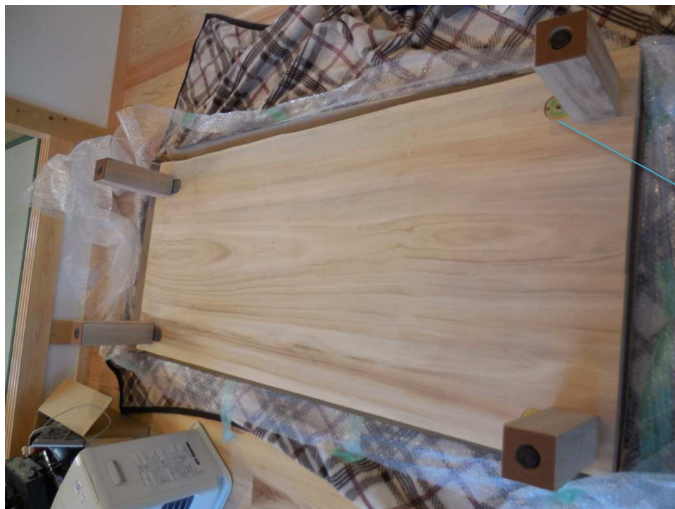
レッグフィックスBです。